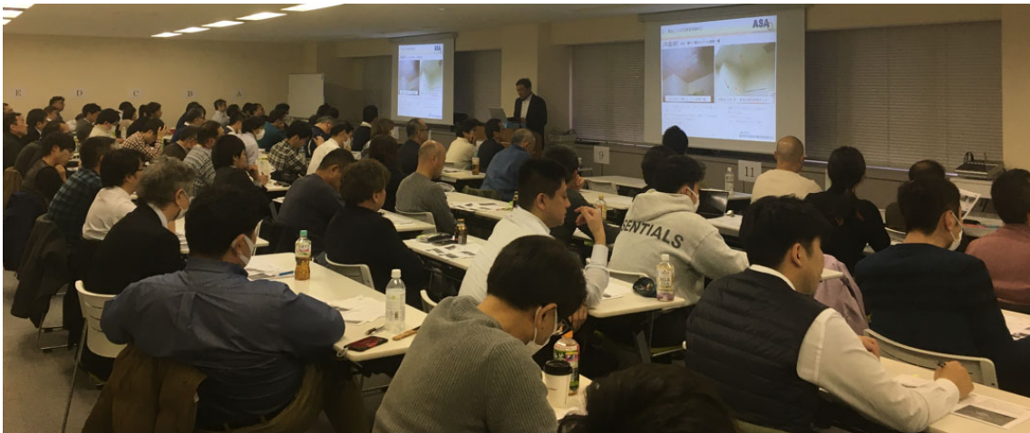
令和2年1月 会場参加風景（オンライン開催なし）

3. オンライン参加される方を対象に、事前に 接続テスト を行う予定です。参加者側のセキュリティ設定等の影響によっては接続できない場合がありますので、事前確認にご協力ください。※オンライン=ウェビナーには zoom アプリが必要です。当日利用される PC、タブレット端末等に事前にインストールしてください。