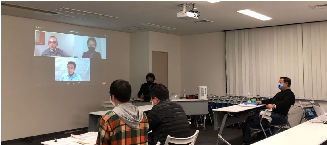
令和3年1月ウェビナー 会場風景（オンライン・会場参加者合計120名）